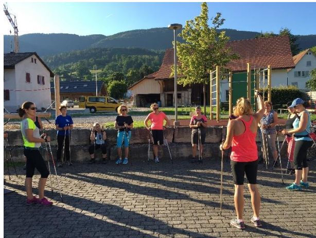
Am 20. Juni 2018 trafen sich 14 Frauen zum zweiten Mal für eine Walkingrunde.

Am 6. Juni 2018 trafen sich 17 Frauen zum gemeinsamen Walking auf dem Begegnungsplatz in Aedermannsdorf.