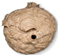
Primärnest (Durchmesser 10-15cm)