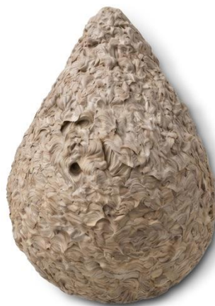
Sekundärnest (bis 80cm gross)